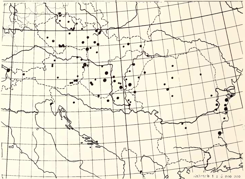
Abb. 2. Die Fundstellen von Odinshühnchen (Wegzug). — Anzahl: • = 1, ● = 2 bis 10, ● = über 10 Ex. — Maßstab 1 : 6 000 000.